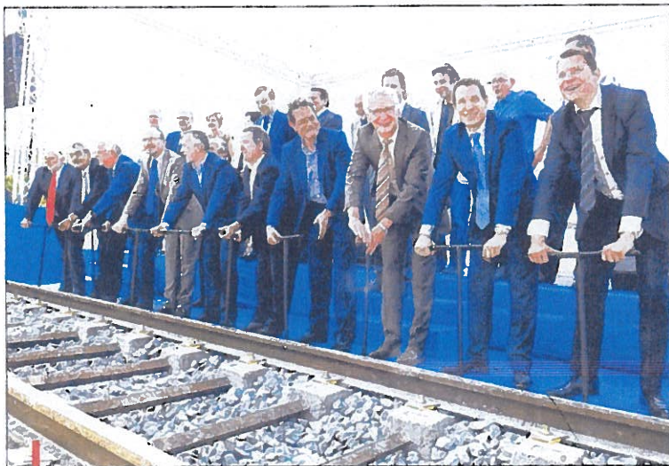
Depuis le succès de la manifestation de 2006 avec un voyage en train symbolique entre Avignon et Carpentras, l'idée a fait son chemin et passe à sa réalisation.