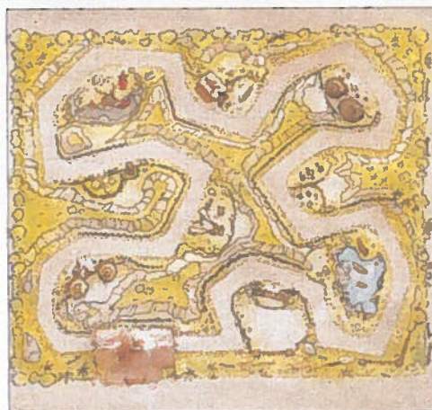
Le plan du parcours scénique « Aventures Africaines »

été choisies pour leur originalité et leur exclusivité, et certaines d'entre elles ont été conçues spécifiquement pour le Parc Spirou. L'objectif des porteurs du projet, s'adresser à un public familial. Les plus petits ayant accès à l'univers de Spirou à travers des dessins animés visibles à la télévision, et les plus grands qui prendront du plaisir à replonger dans l'univers du journal de Spirou. Un type d'attraction est particulièrement adapté à tous les âges, le parcours scénique, dont les attractions les plus célèbres dans cette catégorie se trouvent chez Disneyland : Jungle Cruise, Pirates des Caraïbes, Peter Pan, Small World.