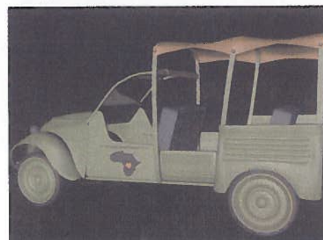
Des véhicules inspirés de l'album "Le Gorille à bonne mine"